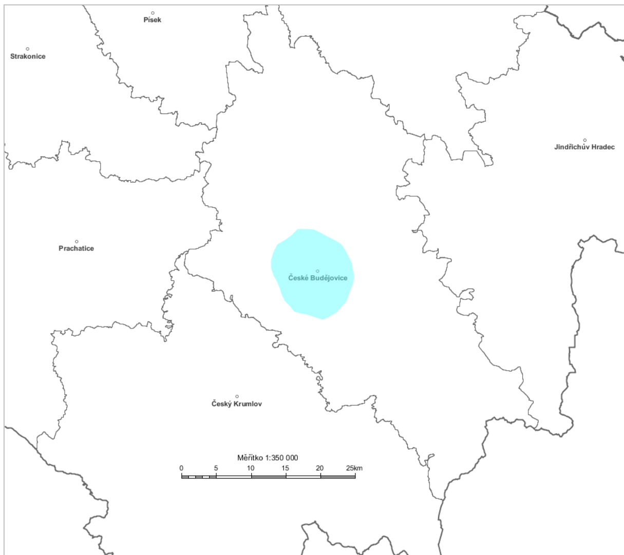
Diagram využití rádiového kmitočtu CESKE BUDEJOVICE V 100,2 MHz stanovený výpočtem podle vyhlášky č. 22/2011 Sb. o způsobu stanovení pokrytí zemského rozhlasového vysílání ve vybraných kmitočtových pásmech – modrá barva.