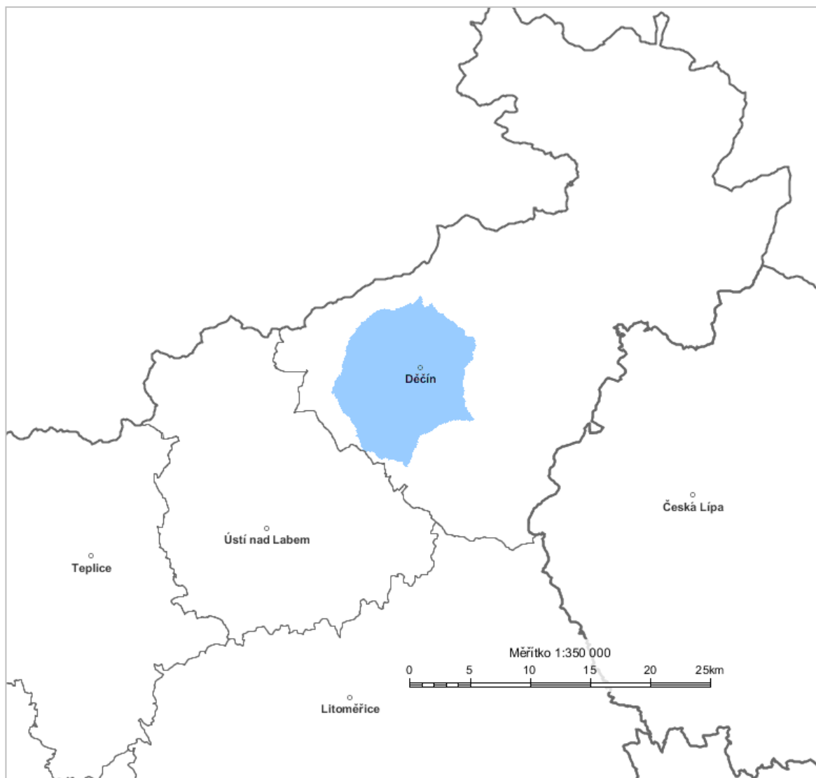
Diagram využití rádiových kmitočtů určených pro analogové vysílání v pásmu VKV pro vysílač DECIN MESTO 2 87,6 MHz, stanovený výpočtem podle vyhlášky č. 22/2011 Sb. (modrá barva).