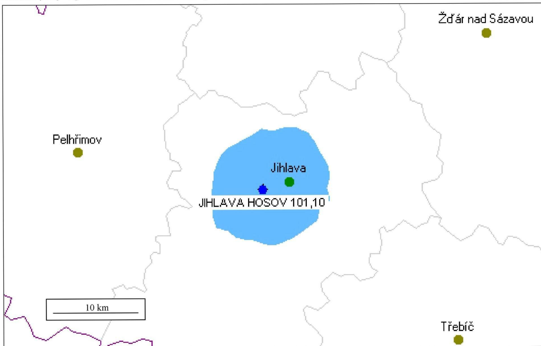
Diagram využití VKV radiového kmitočtu JIHLAVA HOSOV 101,1 MHz, stanovený výpočtem podle vyhlášky č. 22 /2011 Sb. o způsobu stanovení pokrytí signálem zemského rozhlasového vysílání.

Příloha k dopisu čj. ČTÚ-86 184/2013-613 ze dne 29. 8. 2013.