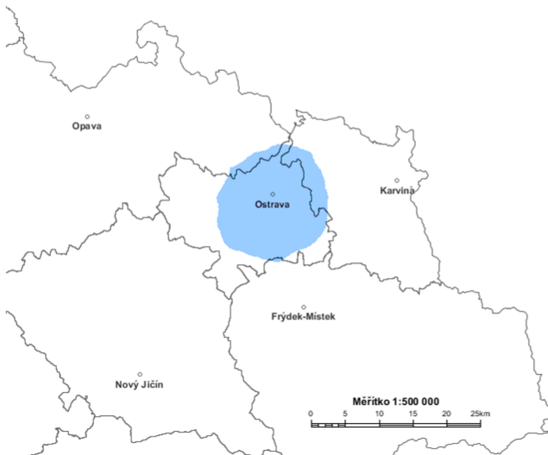
Diagram využití rádiových kmitočtů