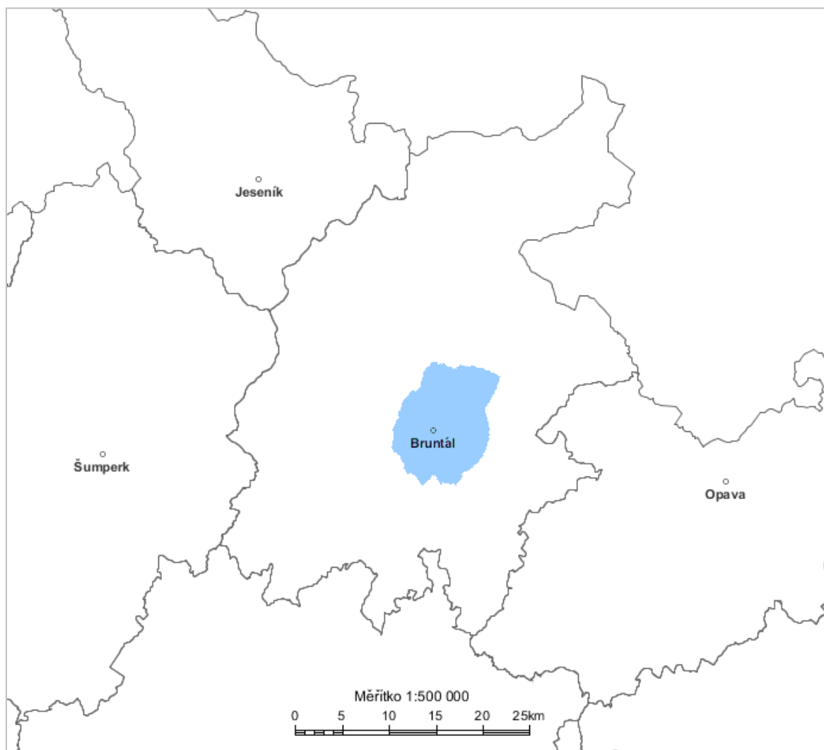
Diagram využití rádiových kmitočtů určených pro analogové vysílání v pásmu VKV pro vysílač BRUNTAL 88,9 MHz, stanovený výpočtem podle vyhlášky č. 22/2011 Sb. (modrá barva).