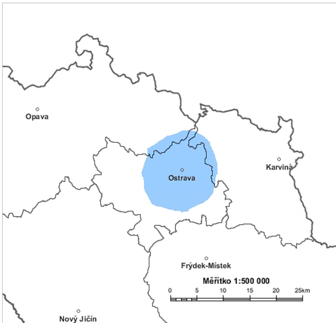
Diagram využití rádiového kmitočtu OSTRAVA MESTO 2 99,5 MHz stanovený výpočtem podle vyhlášky č. 22/2011 Sb. o způsobu stanovení pokrytí zemského rozhlasového vysílání ve vybraných kmitočtových pásmech – modrá barva.