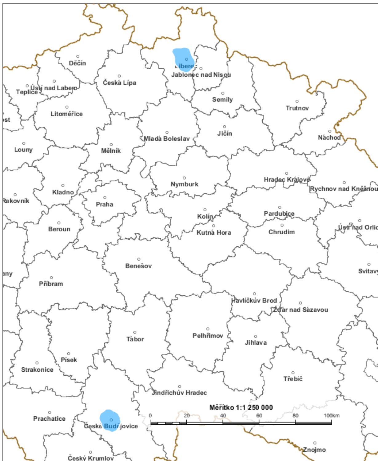
Diagram využití rádiových kmitočtů určených pro analogové vysílání v pásmu VKV pro vysílače C BUDEJOVICE V 100,2 MHz a LIBEREC MESTO II 98,7 MHz stanovený výpočtem podle vyhlášky č. 22/2011 Sb. (modrá barva).