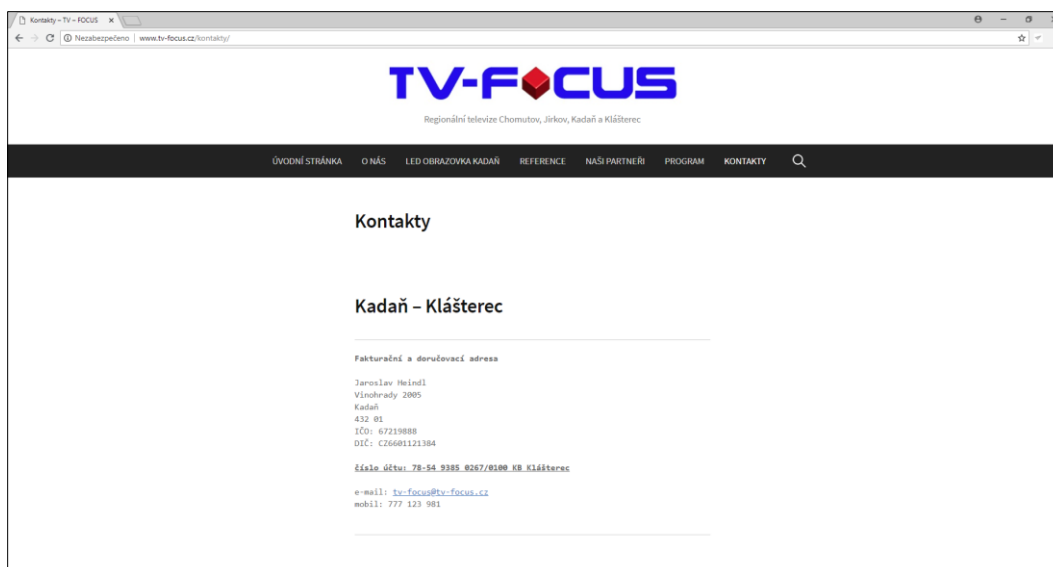
Obrázek 1: Plnění povinností dle § 32 odst. 7 zákona o vysílání.