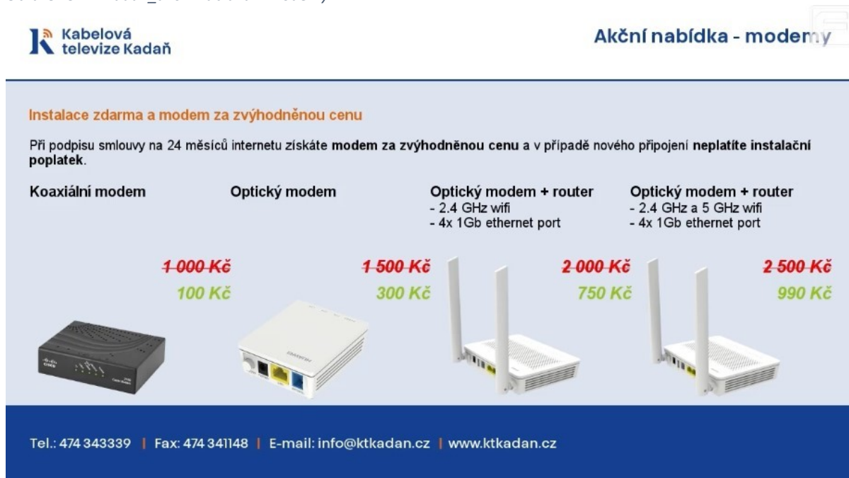
Obrázek 3: KT Kadaň_akční nabídka – modemy.