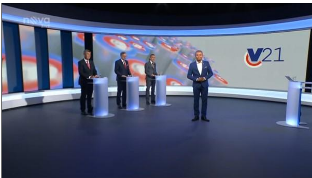
Schéma devadesátiminutového pořadu bylo téměř shodné s relací analyzovanou výše. Diskuze započala úvodní pasáží, následovaly tři hlavní tematické celky a závěrečná část, v níž hosté vyzvali občany k volbě svého politického uskupení.